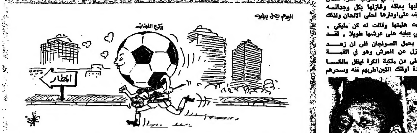
اليوم يصل بيليه

ناسك تعبد في محراب الكرة كان خاطبها بعقله وفنائه بكل وجدانه نزهت على اوتارها احدى الايمان والملك احدثها وقتلت له كن مليكي . وقتي بيليه على عرشها طويلا . لقد ظل يحمل الصولجان الى ان زهد فنزل عن العرش وهو في التيبة وتخلي عن ملكة الكرة ليظل ملكها افئدة اولئك الذين اطروهم منه وسحرم